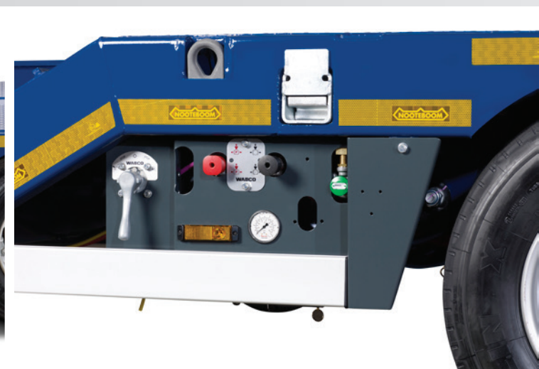
Centralny panel sterowania

Dla transportu np. sprzętu gaśnicowego, muldy międzyosiowe mogą być wypełnione galwanizowanymi podstawami z drewnianym wypełnieniem. Jako opcja, oferowane jest również całkowite wypełnienie muld elementami z twardego drewna egzotycznego.