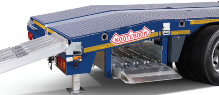
Kosz do przechowywania ramp

Aby zminimalizować masę własną i podwyższyć ładowność, naczepa została wyposażona w aluminiowe rampy najazdowe. Mogą one być łatwo złożone w specjalnym koszu zamontowanym pod tylnim ścięciem naczepy. Na życzenie dostępne są również hydrauliczne rampy najazdowe.