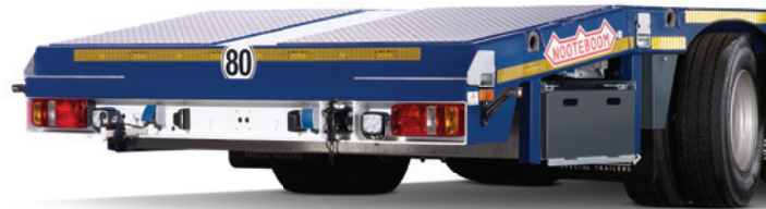
Łatwy ładunek / rozładunek

Aby zminimalizować masę własną i podwyższyć ładowność, naczepa została wyposażona w aluminiowe rampy najazdowe. Mogą one być łatwo złożone w specjalnym koszu zamontowanym pod tylnim ścięciem naczepy. Na życzenie dostępne są również hydrauliczne rampy najazdowe.