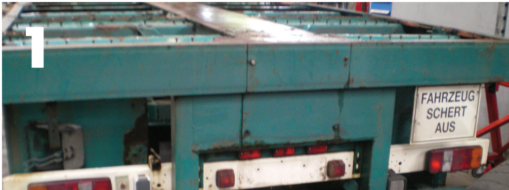
Het voertuig wordt ontmanteld