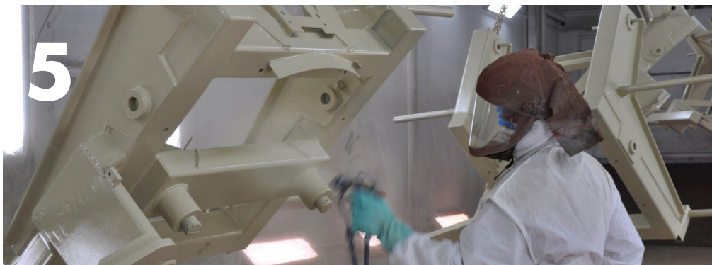
Na de antiroest behandeling volgt het aanbrengen van twee lagen de PUR primer, de hechtlaag en corrosiewering voor de lak.