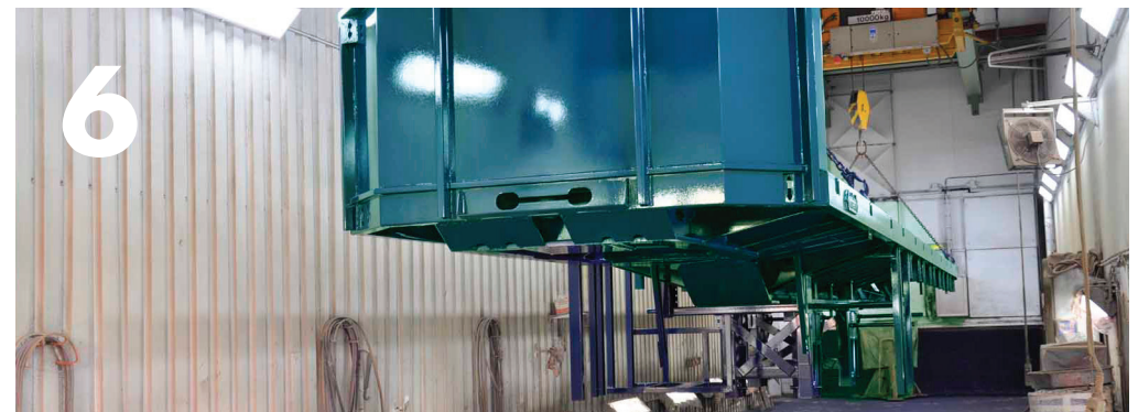
De trailer wordt – in twee spuitlagen – afgelakt met een hoogwaardige Polyurethaan (PU) lak met een optimale hardheid en krasvastheid en een zeer hoge glansgraad. De laklaag is 10 tot 12 jaar bepalend voor de uitstraling van de trailer.