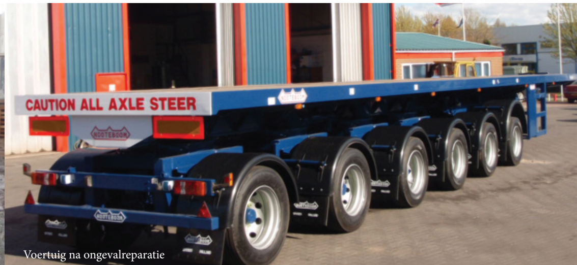
Voertuig na ongevalreparatie