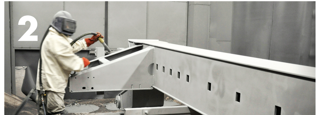
Het hele chassis wordt aangestruild met Korund. Dit is een keihard aluminium materiaal waarmee roest en vuil worden verwijderd. Pas als het chassis de hoogste graad van reinheid heeft bereikt, is de ondergrond geschikt voor de schoopeerlaag.