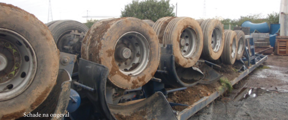
Schade na ongeval