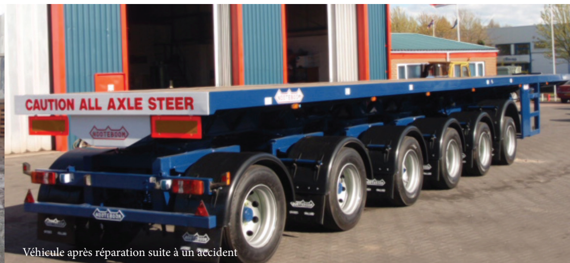
Véhicule après réparation suite à un accident