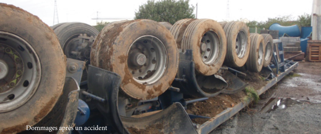
Dommages après un accident