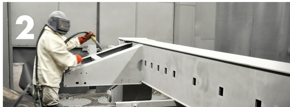
Le châssis est entièrement grenailé avec du corundum, un oxyde d'aluminium extrêmement dur utilisé pour éliminer la rouille et la saleté. Quand le châssis est entièrement nettoyé, la surface est prête à être métallisée.